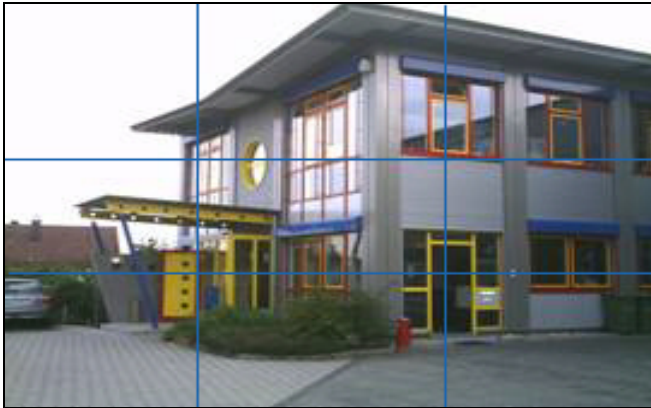
-Şirket merkezi: Stuttgart yakınlarındaki Sachsenheim / Almanya

Aşağıdaki sayfalarda güncel teslimat programımız hakkında bilgiler bulabilirsiniz.