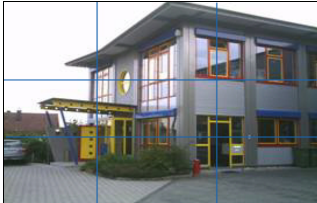
مبنى مقر الشركة في زاكسنهايم بالقرب من شتوتغارت Stuttgart في ألمانيا

وعلى الصفحات التالية تجدون معلومات عن برنامج منتجاتنا الحالية.